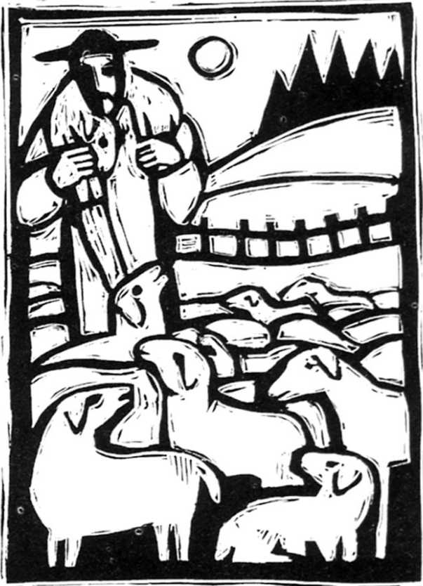
Dieses Bild möchte angemalt werden