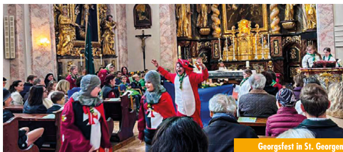
Georgsfest in St. Georgen