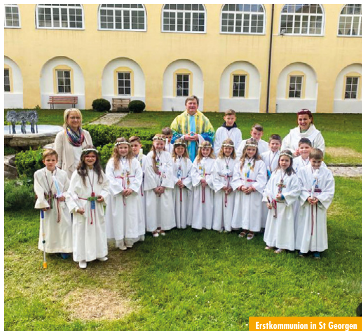
Erstkommunion in St. Georgen