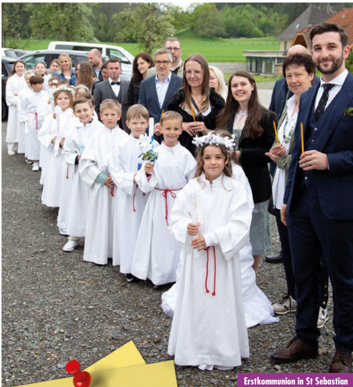
Erstkommunion in St Sebastian