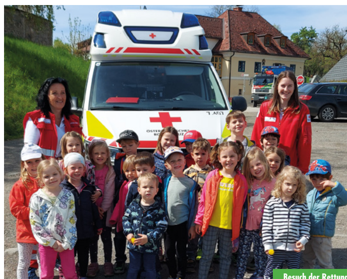
Besuch der Rettung