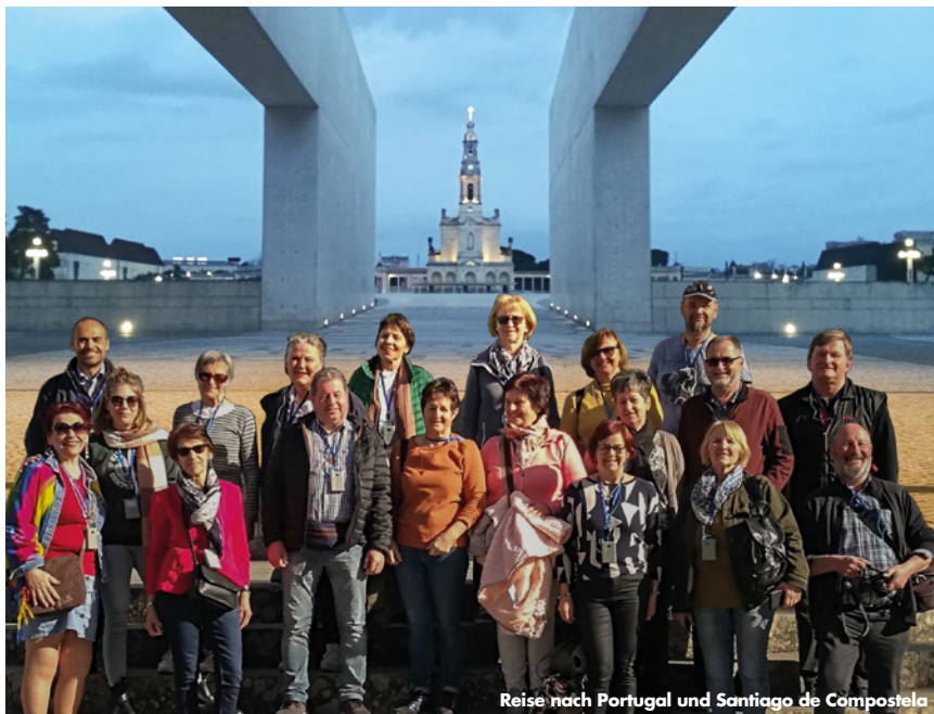
Reise nach Portugal und Santiago de Compostela

Familiengottesdienst und Sommerpfarrkaffee in Launsdorf Sonntag, 2. Juli, 9.30 Uhr