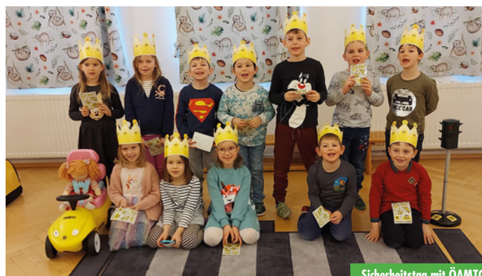
Sicherheitstag mit ÖAMTC