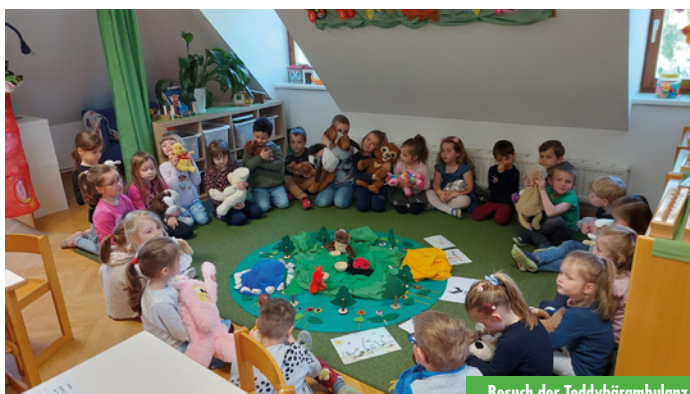
Besuch der Teddybärambulanz