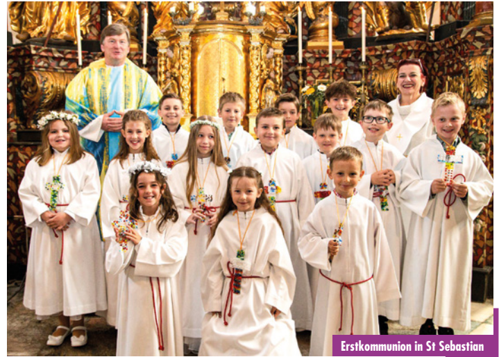
Erstkommunion in St Sebastian