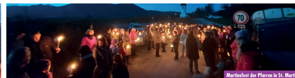
Martinsfest der Pfarren in St. Martin