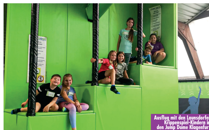
Ausflug mit den Launsdorfer Krippenspiel-Kindern in den Jump Dome Klagenfurt