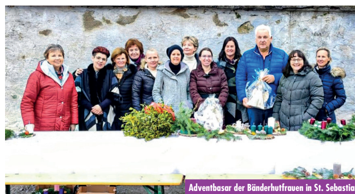
Adventbasar der Bänderhutfrauen in St. Sebastian