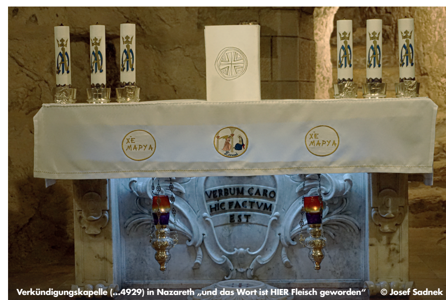
Verkündigungskapelle (...4929) in Nazareth „und das Wort ist HIER Fleisch geworden“