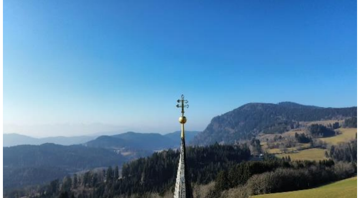
In der Pfarrkirche Gradenegg finden seit 19. Mai Renovierungsarbeiten an den Fresken statt