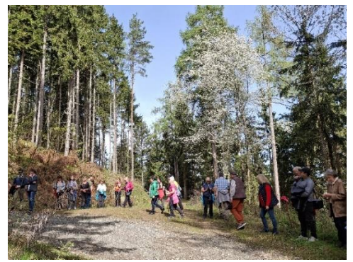
Emmausgang am Ostermontag des Pfarrverbandes St. Veit/Glan, Meiselding, St. Donat, Gradenegg und Sörg