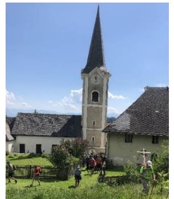
Am Fr. 2. Mai Andacht in Gradenegg