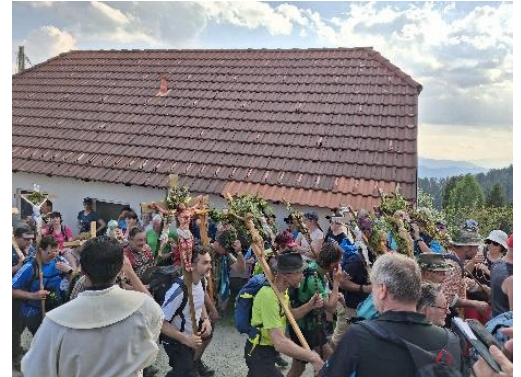
Schlussandacht am Lorenziberg