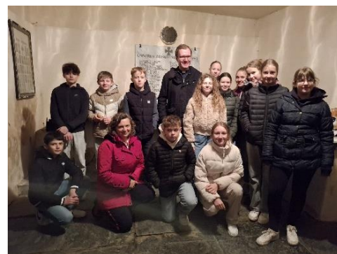
Vorstellungsmesse der Firmlinge mit Fastensuppe