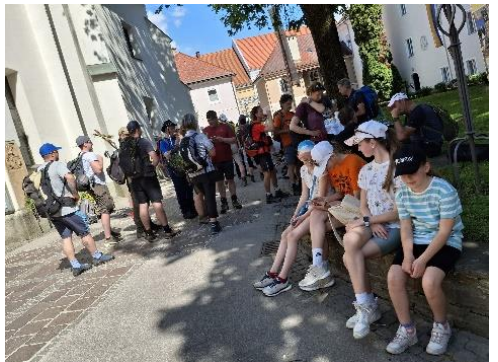
Herzlicher Empfang in St. Veit/Glan