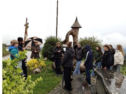
Markusprozession nach Hart mit Begleitung der Firmlinge, anschl. Sendungsmesse