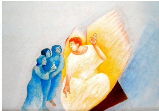
Foto: Begnung mit dem Engel im leeren Grab © Friedbert Simon / Künstler: Polykarp Ühlein In: Pfarrbriefservice.de;

Beim Auf(er)stehen geht es immer um die Lebenskraft Gottes, die uns Menschen geschenkt wird und die wir nicht selber produzieren können. Als Christen müssen wir immer wieder aufstehen gegen Müdigkeit und Lähmung, gegen Ungerechtigkeit und Unterdrückung, gegen Hass und Lieblosigkeit.